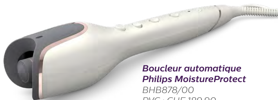
Boucleur automatique Philips MoistureProtect BHB878/00 PVC : CHF 189.90

Embellissez la coiffure au gré de vos envies avec un bel accessoire comme une barrette.