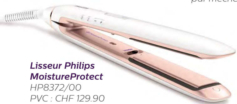
Lisseur Philips MoistureProtect HP8372/00 PVC : CHF 129.90

Attachez les deux torsades ensemble à l'arrière de la tête à l'aide d'un élastique à cheveux.